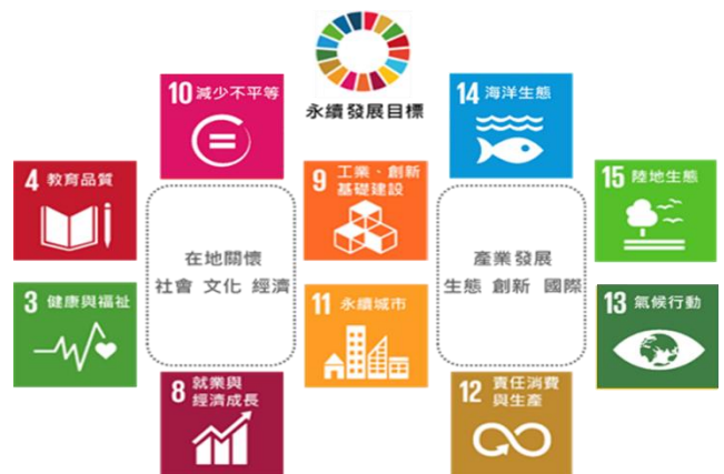
圖 2-1 本校永續發展藍圖

為善盡大學社會責任，本校鼓勵與支持師生參與社會創新實踐，已於在地關懷、產業鏈結及永續發展上累積相當成就，預計積極 規劃本校社會責任發展藍圖 ，以發展具科技創新與產業應用的國際化應用研究型大學為願景，衡量此發展特色，並參考聯合國 17 項永續發展目標 (SDGs)，建構出本校於「在地關懷」與「產業發展」之雙核心發展藍圖(如圖 2-1 所示)，兩者共同構成「永續環境」之價值。