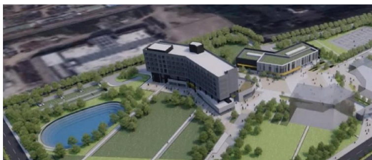
圖 2-2 新竹校區生態滯洪池規劃示意圖

本校逐年以生態滯洪觀點改善校園地景，藉由翻動鬆土讓雨水透過土壤吸收，降低大雨沖刷造成水災現象，搭配生態景觀建構生態滯洪池，目前已完成兩期雨水貯留計畫，另於新竹校區新建之國際書院與先進產學中心，業已規劃滯洪池如圖 2-2 所示。